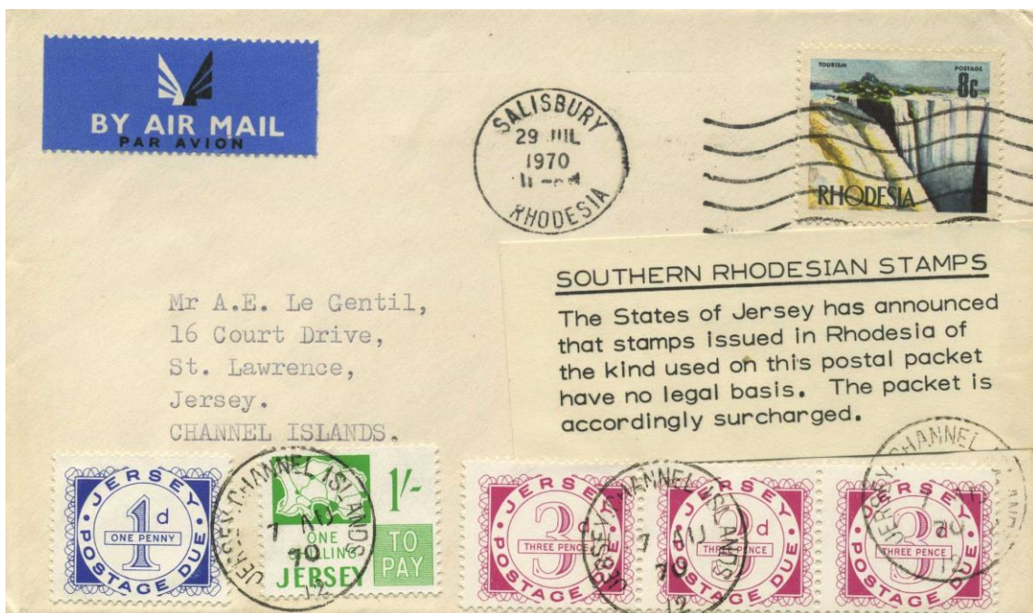
Abb. 3: Sendung nach Jersey mit die Nachgebühr erklärendem Aufkleber

Andere Staaten und Postverwaltungen folgten dem britischen Beispiel. Die Post der Kanal-Insel Jersey klärte ihre Kunden anfangs kaum, aber später umso besser auf – und nutzte die Gelegenheit, mittels der Inschrift der verwendeten Aufkleber auf ihre postalische Unabhängigkeit von Grossbritannien hinzuweisen (siehe Text-Zeile "The States of Jersey has announced..." in Abb. 3).