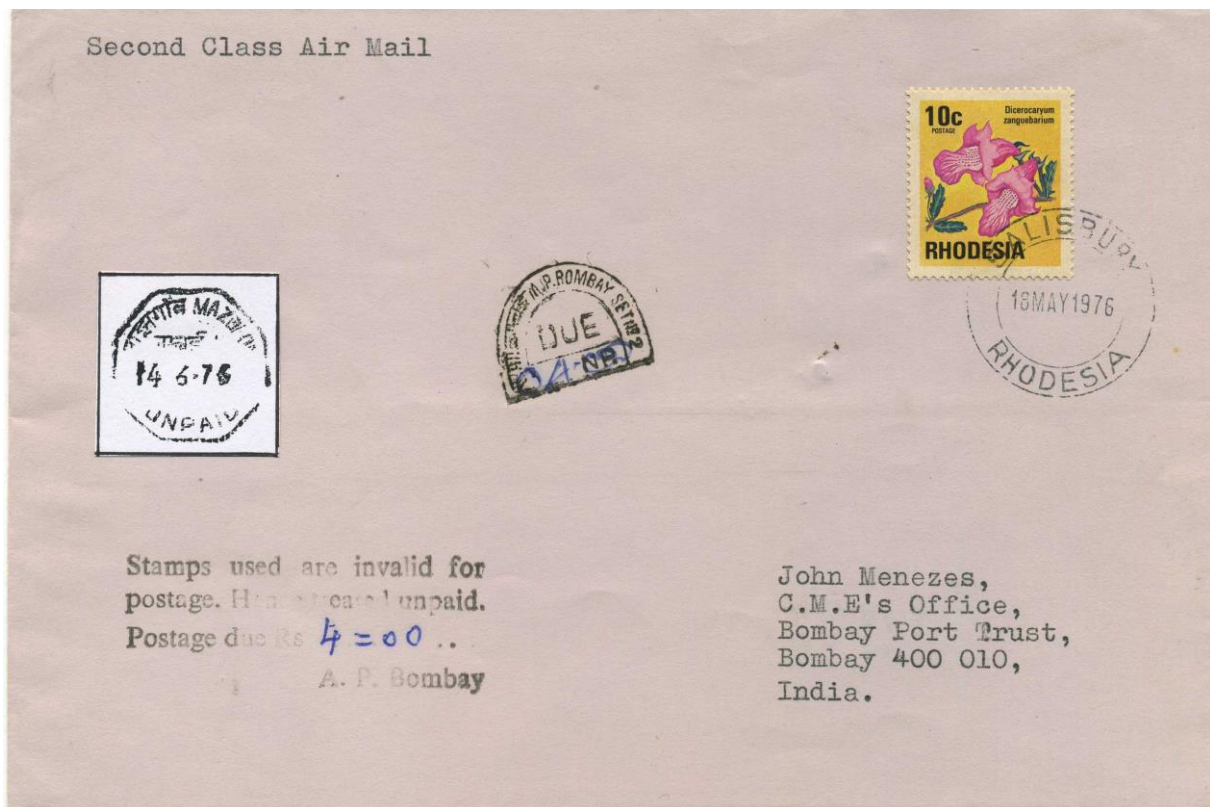
Abb. 4: Sendung nach Indien mit Nachgebührestempel

Nachgebühr auf Post mit Briefmarken Rhodesiens, auch wenn diese Massnahmen nicht immer konsistent gehandhabt wurden bzw. nur Teile des gesamten, in Frage kommenden Zeitraums betrafen. Andere Staaten hatten als Folge der rhodesischen Unabhängigkeitserklärung sämtliche, auch die postalischen Beziehungen mit Rhodesien abgebrochen. Hierzu zählten insbesondere ausser der DDR und einigen anderen Ostblockstaaten auch afrikanische Nachbarn wie Mozambik, Kenia und Tanzania. Da jedoch Post von und nach Rhodesien über die Republik Südafrika lief, mit der auch diese Staaten normale Postbeziehungen unterhielten, kommen auch normal beförderte Belege vor.