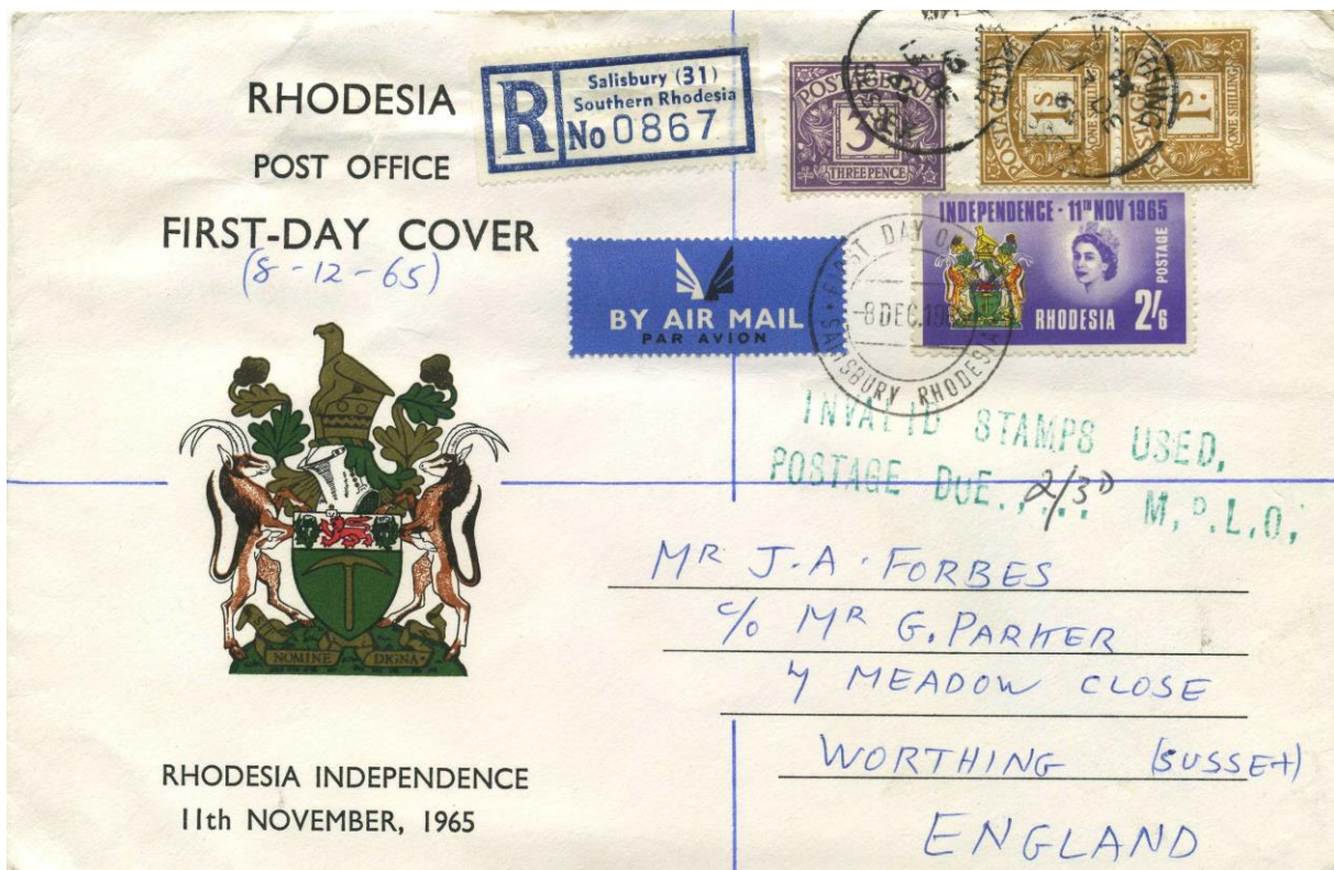
Abb. 1: FDC der rhodesischen Unabhängigkeitsmarke in England nicht anerkannt und mit Nachgebühr belegt

Die politische Entwicklung konnte nicht ohne postalische Folgen bleiben. Die Herausgabe eigener Briefmarken, noch dazu mit eigenem Staatswappen und die illegale Unabhängigkeit würdigendem Überdruck, wurden als das angesehen, was sie auch bezwecken sollten: als Provokation. Grossbritannien erkannte diese Marken nicht an. Der Empfänger von mit ihnen frankierter Post musste Nachgebühr in zweifacher Höhe des Original-Portos entrichten (Abb. 1).