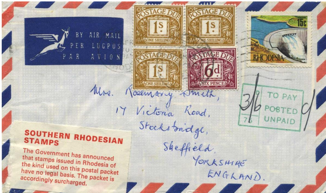
Abb. 2: Sendung nach England mit dem die Nachgebühr erklärenden Aufkleber

Andere Staaten und Postverwaltungen folgten dem britischen Beispiel. Die Post der Kanal-Insel Jersey klärte ihre Kunden anfangs kaum, aber später umso besser auf – und nutzte die Gelegenheit, mittels der Inschrift der verwendeten Aufkleber auf ihre postalische Unabhängigkeit von Grossbritannien hinzuweisen (siehe Text-Zeile "The States of Jersey has announced..." in Abb. 3).