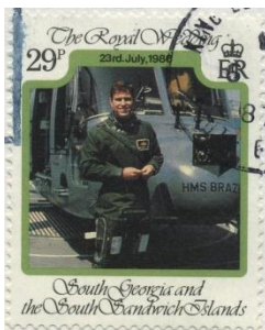
1986.5 Marke Prince Edward

Grund der Zurücksendung ist Artikel 28 der UPU Convention 1984 (ungültige Postwertzeichen) und die Empfehlung dass die Darstellungen auf Postwertzeichen zum besseren Verständnis der Völker und zur internationalen Freundschaft beitragen sollen.