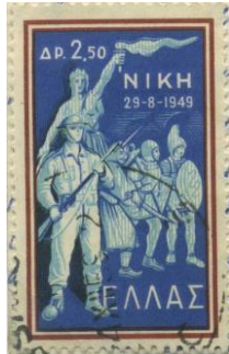
Griechenland: Marke NIKH

Rumänien beanstandete Sendungen mit dieser Marke und machte sie weitgehend unkenntlich mit Hilfe des 10 Jährigen NATO-Bestehens (1959.1 – F) verwendeten politischen Gegenstempels.